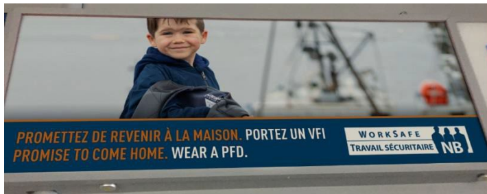
Publicité murale au Colisée de Moncton