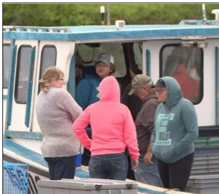
Des gens se rassemblent sur le quai Miller Brook, près de Bathurst, après que deux pêcheurs de homards ont perdu la vie lorsque leur bateau a chaviré au large du quai dans la baie des Chaleurs.

Jusqu'à ce que la Loi sur l'hygiène et la sécurité au travail soit modifiée pour inclure les navires de pêche comme lieu de travail, Travail sécuritaire NB ne peut pas assurer la conformité de l'utilisation des VFI sur les navires de pêche commerciale comme le recommande le BST.