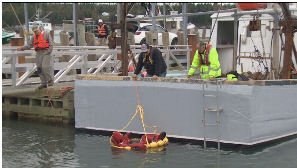
La campagne de sensibilisation aux VFI de Travail sécuritaire NB comprenait des exercices d'« homme à la mer » pour promouvoir l'utilisation des VFI à Deer Island, Dipper Harbour et Grand Manan.

Travail sécuritaire NB a élaboré une campagne de sensibilisation aux VFI et a parrainé des exercices d'« homme à la mer » à trois endroits dans le sud de la province – Deer Island, Dipper Harbour et Grand Manan – à l'automne. Ces exercices ont attiré une centaine de participants et plusieurs médias. Les exercices ont démontré les différents types de techniques et d'équipements de sauvetage nécessaires pour récupérer une personne tombée à la mer, ainsi que d'autres procédures d'urgence, comme l'abandon du navire.